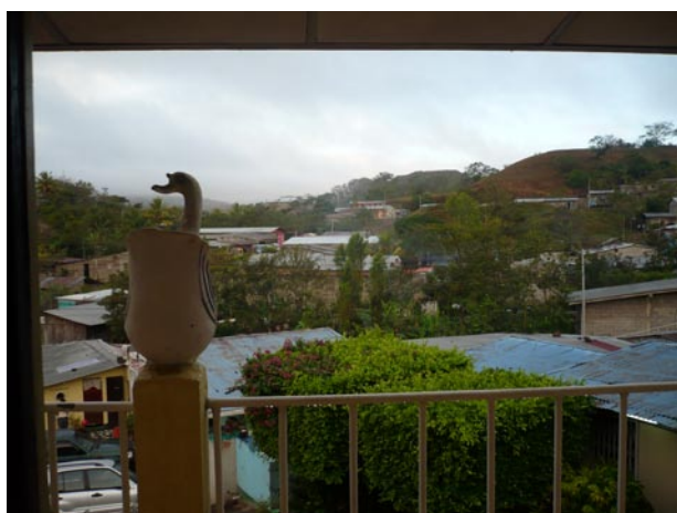
Vistes des de l'habitació

La carretera, de nit, estava esquitxada de llumetes que de tant en tant es creuaven per la finestra, mostrant existències disperses que viuen o sobreviuen lluny dels nuclis urbans. Per fi, Camoapa, un lliit.