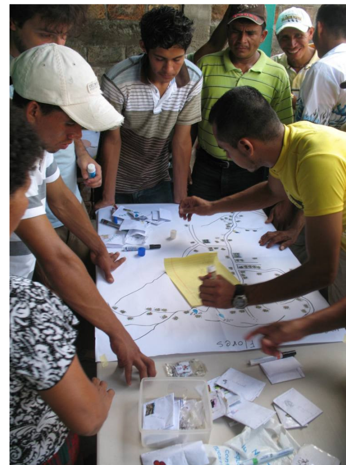
Dissenyant el sistema d'abastament i sanejament d'aigua en una comunitat d'El Salvador.

- El grup de Sobirania Alimentària pretén identificar les estructures de poder que legislen sobre el model de producció i distribució dels aliments i així transformar la societat. Busca un canvi d'orientació on el sistema de treball del camp no estigui cada cop en menys mans i que s'enfoqui cap a un model ecològic, més just pel pagès i que enforteixi la societat.